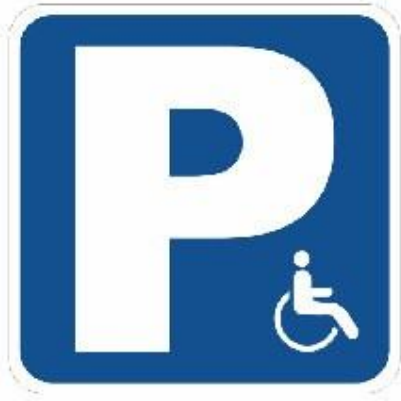
A) SEÑAL S-17 con símbolo insertado