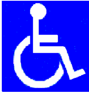
C) SEÑAL V-15